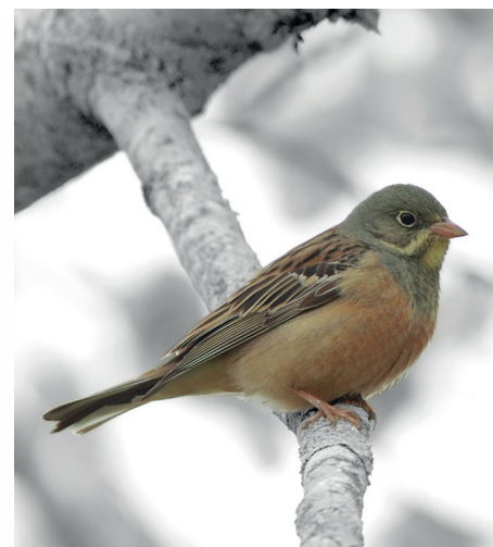
Innerhalb nur fünfzehn Jahren (1990–2005) ist der Ortolan aus der niederländischen Agrarlandschaft verschwunden.

Auch hinsichtlich der möglichen Auswirkungen von Pestiziden auf die menschliche Gesundheit wächst die Besorgnis. Es