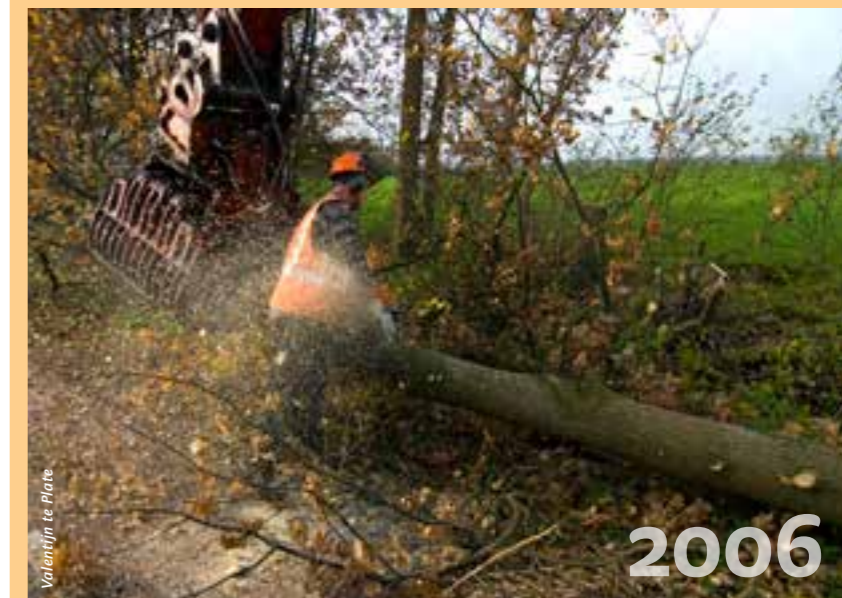
Valentijn te Plate