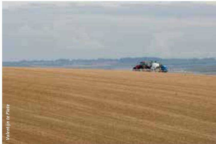
Valentijn te Plate

De intensieve landbouw verdreef veel plant- en diersoorten uit onze agrarische landschappen.