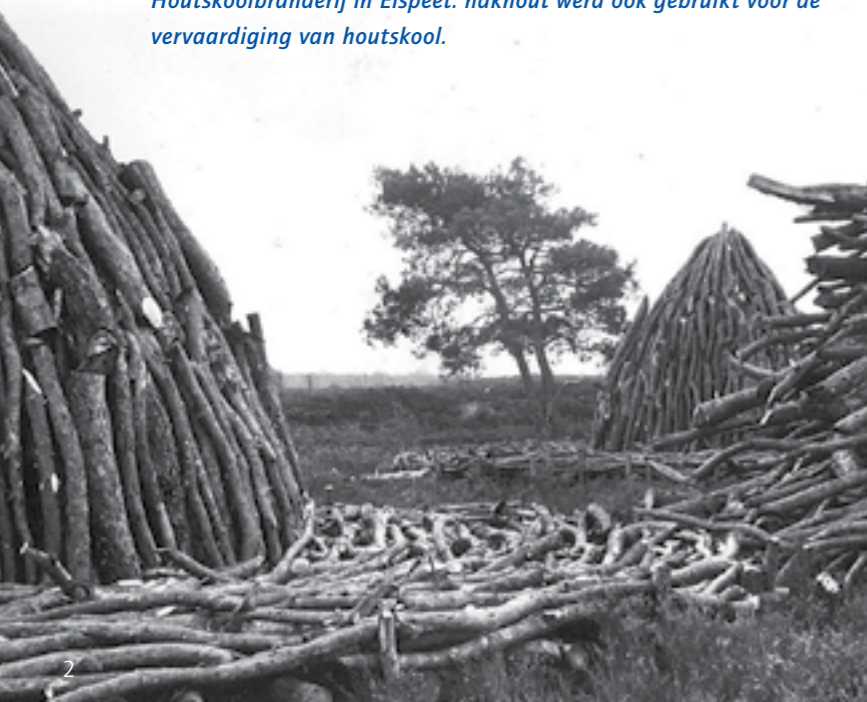
Houtskoolbranderij in Elspeet: hakhout werd ook gebruikt voor de vervaardiging van houtskool.