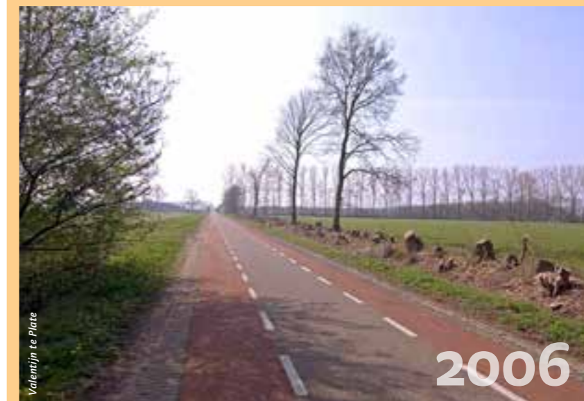
Valentijn te Plate